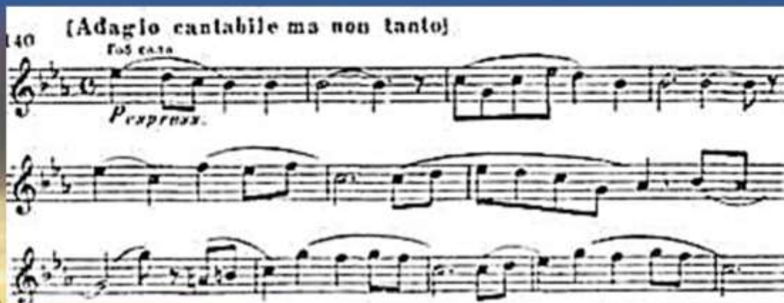
Пример 3. II часть. Основная тема (Es-Dur)